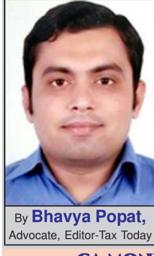
By Bhavya Popat , Advocate, Editor-Tax Today