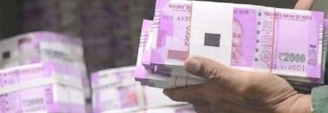
નોટ ઓજે પણ વૈધ ચલાવે જ છે. કઈ વ્યક્તિ આ ૨૦૦૦ ની નોટ જમા કરાવવાનું ચૂકી ગયા હોય તો તેઓ

તા. ૦૩.૧૧.૨૦૨૩ RBI દ્વારા ૩૦ સપ્ટેમ્બર સુધીમાં ૨૦૦૦ ની નોટો બેન્કમાં જમા કરાવવાની અથવા બદલી કરવાની થતી હતી. વણા લોકો આ ૨૦૦૦ ની નોટો બેન્કમાં જમા કરાવવા કે બદલાવવાનું ચૂકી ગયા હતા. આ કારણે લોકો ચિંતિત હતા. RBI દ્વારા ૦૧ નવેમ્બર ૨૦૨૩ ના રોજ પ્રેસ વિસ્ટા બહાર પાડી પુલાસો કરવામાં આવ્યો છે કે ૨૦૦૦/-ની