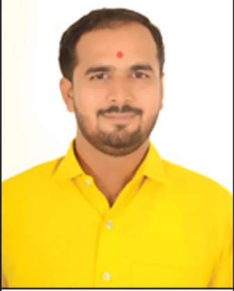
-By Prashant Makwana, Tax Consultant